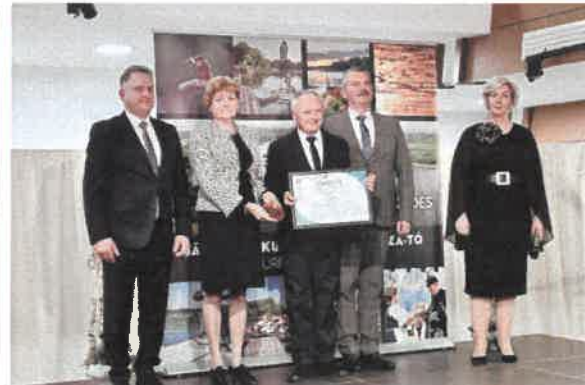
Elegáns környezetben zajlott a turisztikai gála 2024. november 29-én Karcagon, ahol a Jászkunságért és a Tisza-tóért dolgozó turisztikai szakemberek kaptak elismeréseket