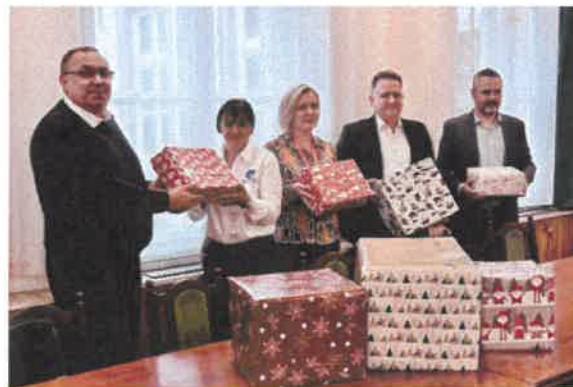
Sajtótájékoztatóval indult az Adventi Szeretetdoboz elnevezésű jótékonyági akció, amelynek köszönhetően közel 150 doboznyi tartós élelmiszert, ruhákat, gyermekjátékokat, könyveket, higiéniai és tisztálkodási terméket nyújtottunk át a rászoruló családoknak

A Vármegyei Önkormányzat mindezek mellett további kötelező és önként vállalt feladatai között turizmusfejlesztéssel, kommunikációval, sportügyekkel, civil és társadalmi, ifjúsági- és nyugdíjas ügyekkel kapcsolatban is több jelentős programot valósított meg. Aktív kapcsolatot tartunk fent a Jász-Nagykun-Szolnok Vármegyei Diák Önkormányzattal, vármegyénk meghatározó civil szervezeteivel. Öt éve a Vármegyei Önkormányzat fokozta jótékonyági kezdeményezésekben való ernyőszervezeti tevékenységét, kezdeményező és koordinatív szerepvállalását (pl. Magyar Református Szeretetszolgálat, Ökumenikus Segélyszervezet, Katolikus Karitasz akcióinak támogatása, iskolakezdési és karácsonyi adománygyűjtés).