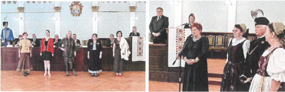
A Nemzeti Jászkun Emléknap tiszteletére 2024-ben is megtartottuk Redemptio emlékezésünket, amelyen a Jászkunság kulturális öröksége kiemelt hangsúlyt kap

A Vármegyei Önkormányzat mindezek mellett további kötelező és önként vállalt feladatai között turizmusfejlesztéssel, kommunikációval, sportügyekkel, civil és társadalmi, ifjúsági- és nyugdíjas ügyekkel kapcsolatban is több jelentős programot valósított meg. Aktív kapcsolatot tartunk fent a Jász-Nagykun-Szolnok Vármegyei Diák Önkormányzattal, vármegyénk meghatározó civil szervezeteivel. Öt éve a Vármegyei Önkormányzat fokozta jótékonyági kezdeményezésekben való ernyőszervezeti tevékenységét, kezdeményező és koordinatív szerepvállalását (pl. Magyar Református Szeretetszolgálat, Ökumenikus Segélyszervezet, Katolikus Karitasz akcióinak támogatása, iskolakezdési és karácsonyi adománygyűjtés).